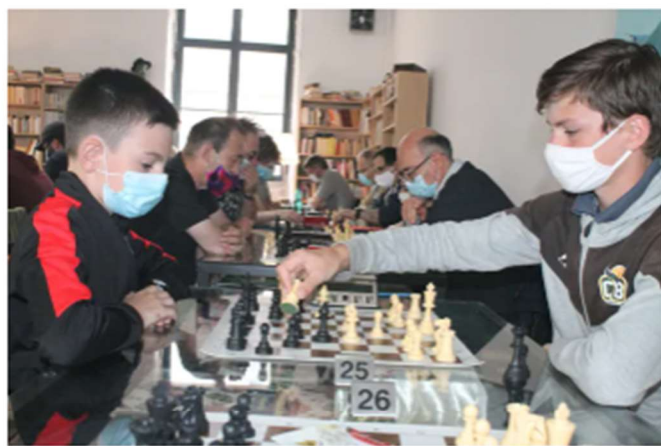
La réussite du tournoi, l'an dernier, a donné envie de récidiver.